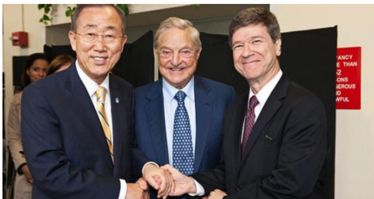
UN Secy Gen Ban Ki Moon, George Soros and Jeffrey Sachs

Čeprav Soros financira radikalne katoliške skupine, ni mogel ujeti papeštva kot dokončnega dobitka pri obvladovanju sveta, ker sta prejšnja dva konservativna papeža odločno nasprotovala njegovi radikalni agendi. Vse do zdaj.